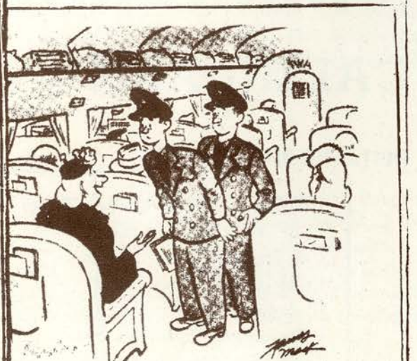
—¿Quién de ustedes dos es el piloto automático? (De "La France Nouvelle".—Paris).