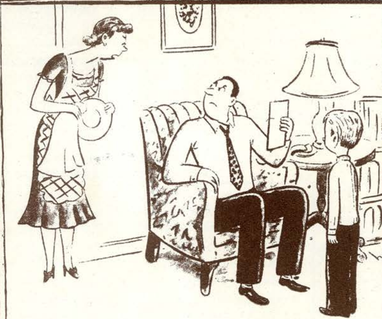
—Supongamos que no tiene las mejores calificaciones de su clase... ¿Acaso tienes tú el mejor sueldo de tu oficina?