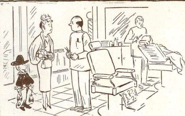
—¿Sabe usted, por casualidad, cómo se cortaba el pelo Buffalo Bill? (De "The New Yorker".—N. Y.).