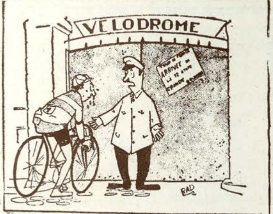
—Lo siento, amigo, pero llega usted con mucho adelanto. El velódromo no se abre hasta dentro de media hora...