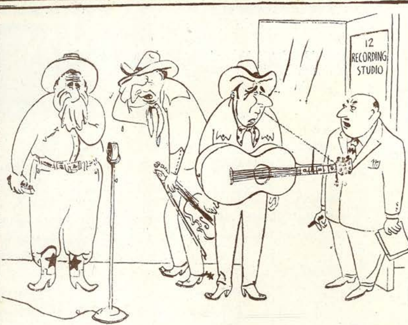
—Ya sé que la canción es muy triste, muchachos, pero ¿no podíamos hacer un esfuerzo para acabarla aunque sea una sola vez?