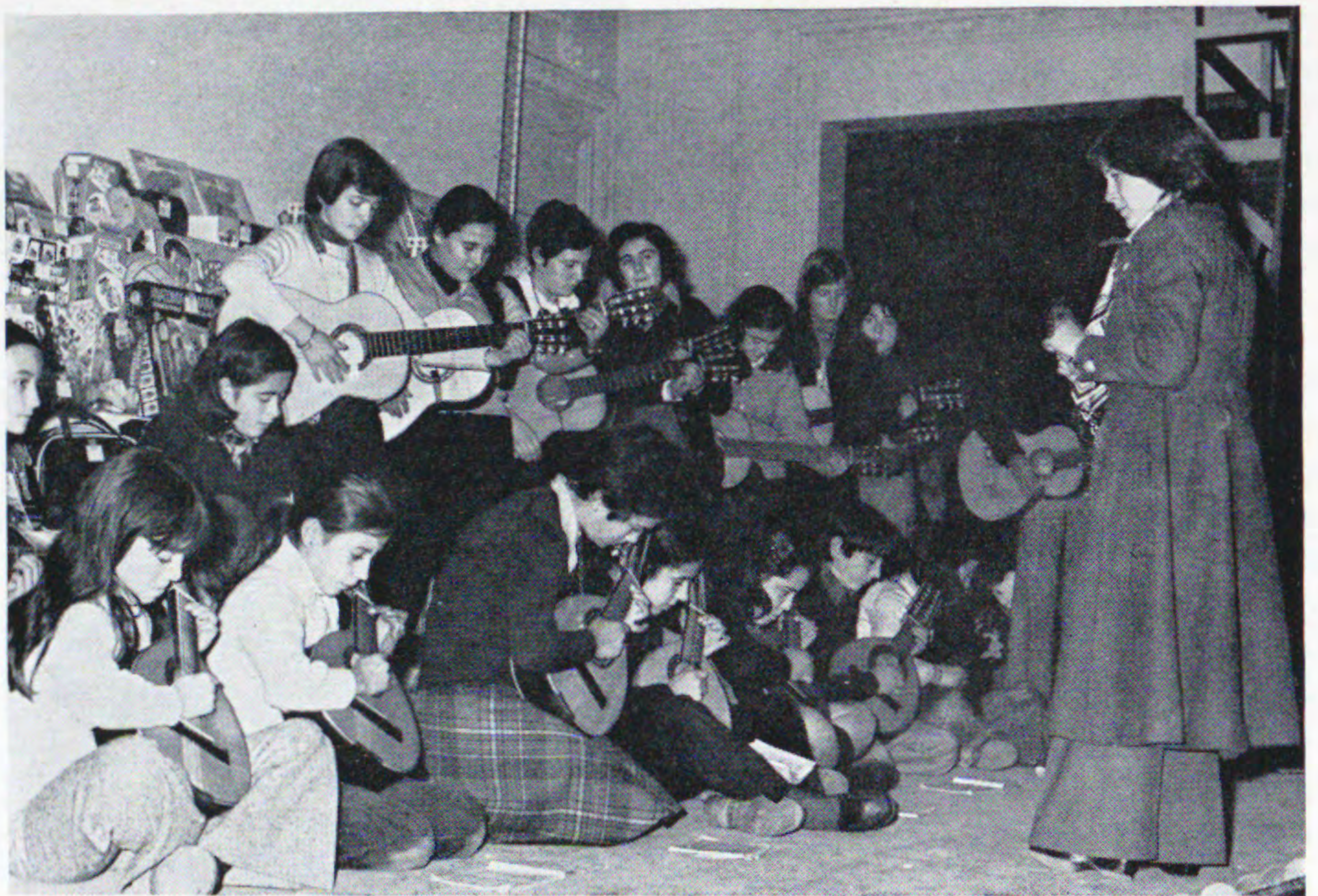
El diapasón de la profesora de música está ya dando el tono y las chicas de la Rondalla escolar van a empezar a pulsar las cuerdas.

¡Sí, como un año y otro año, una fiesta jubilosa de risas y sueños infantiles!