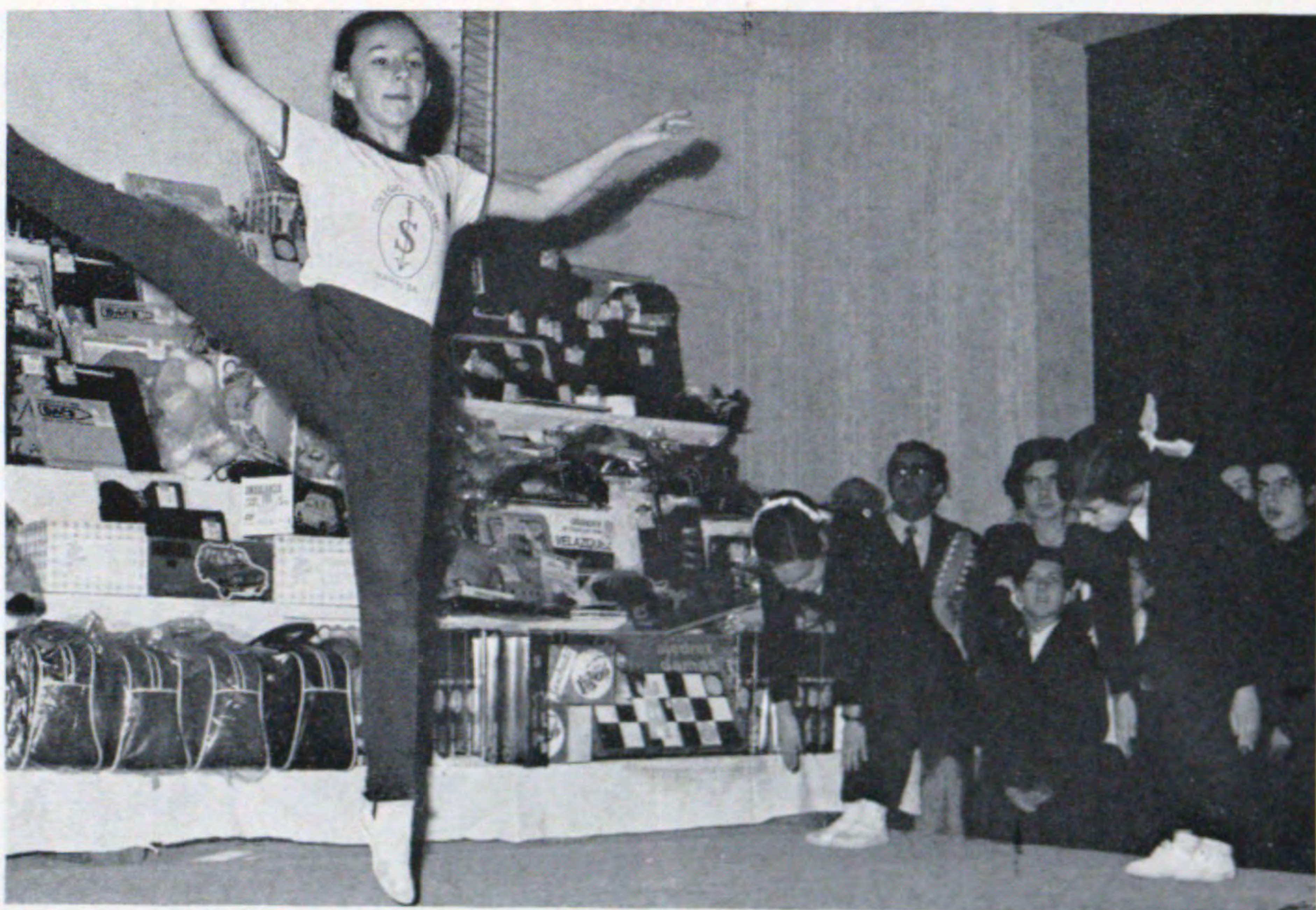
Deporte de sala. Casi ballet. Ritmo y gracia... De esto tuvieron los ejercicios gimnásticos que escenificaron tres niñas.