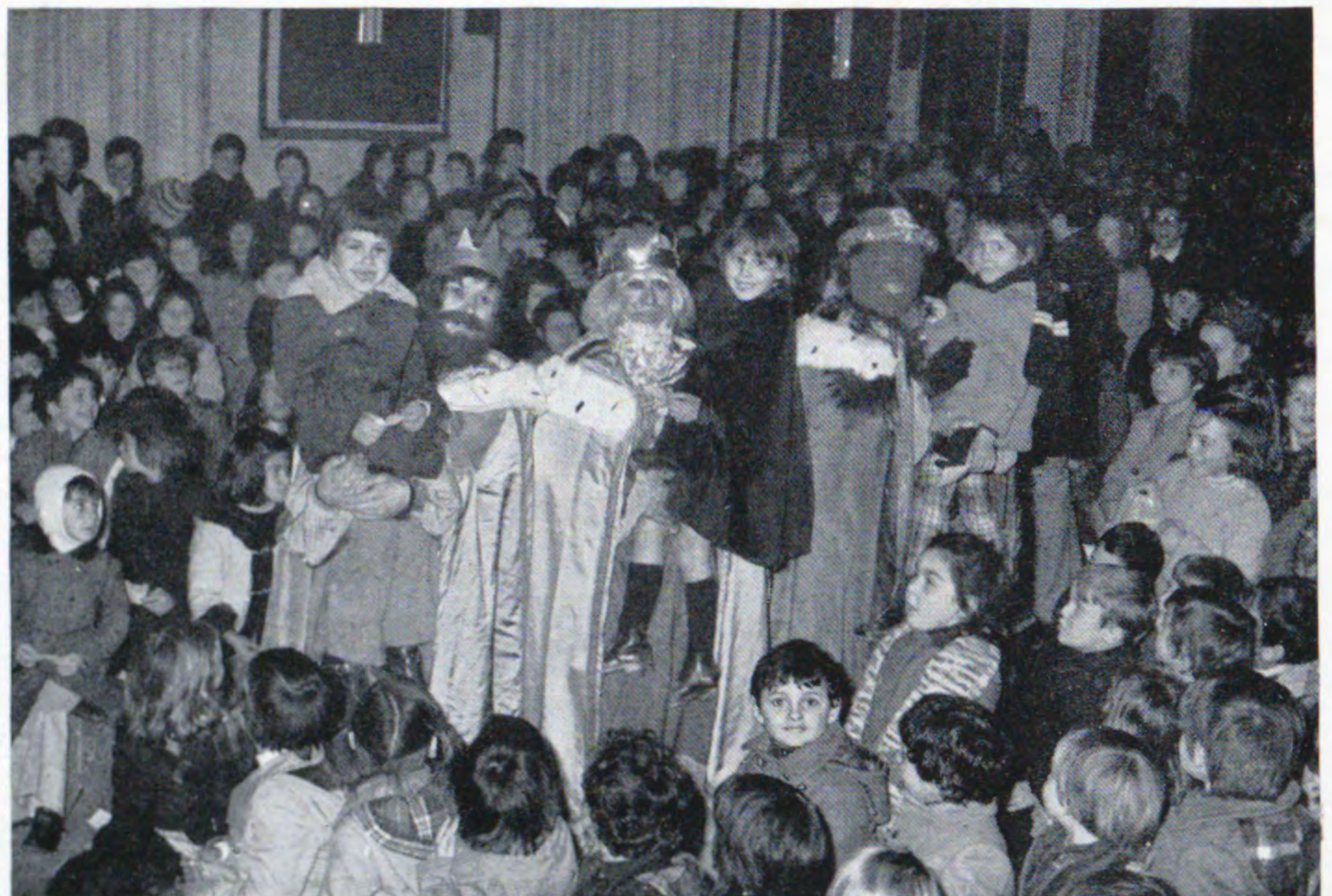
Terminó el prólogo musical de la fiesta y están ya los Reyes Magos envueltos en la expectación y alegría de los pequeños.