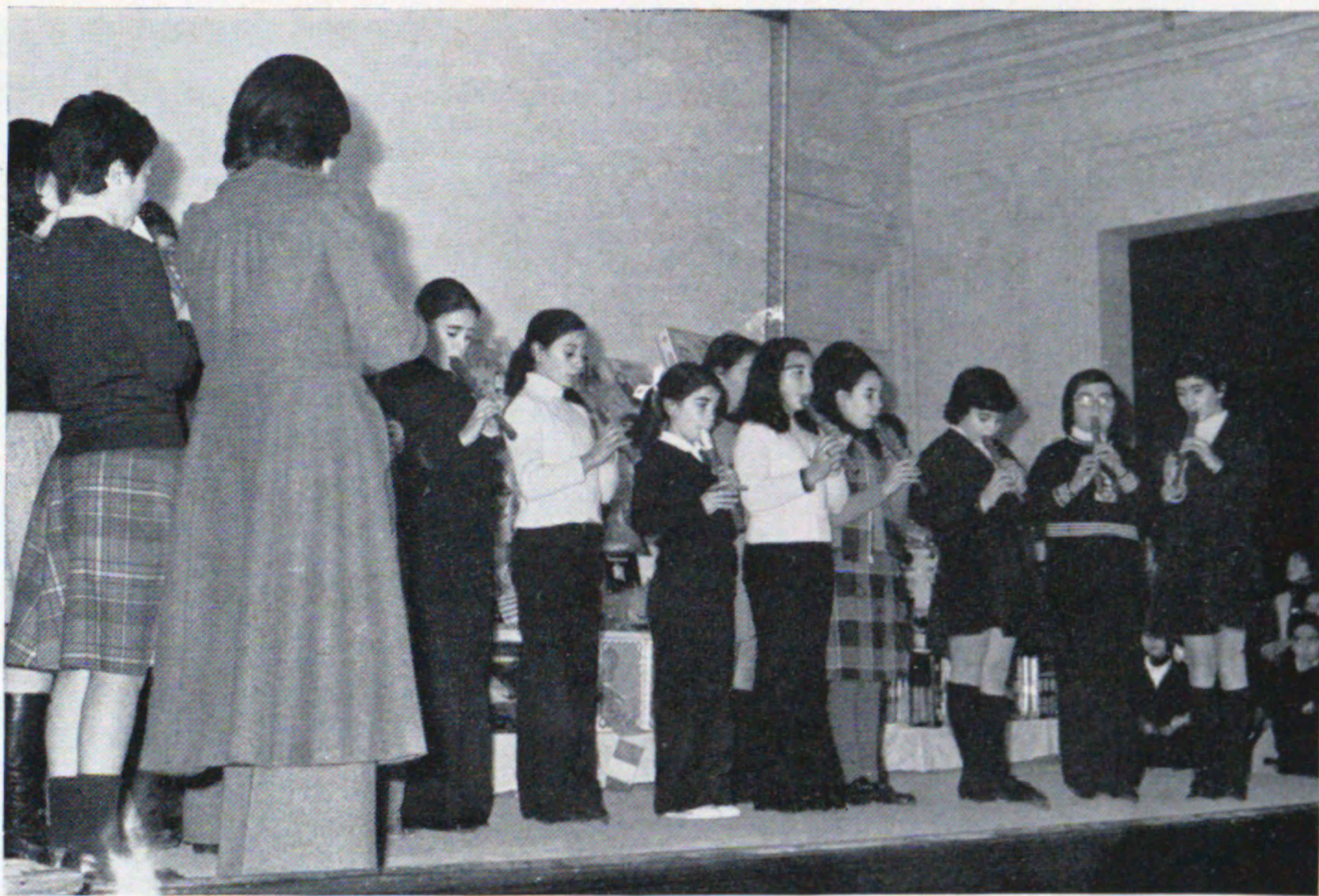
Esta Rondalla Colegio Solvay rompió el fuego -flautas en boca- en el festival infantil de Reyes celebrado en el Cinema.

La última actuación fue la de la Rondalla Escolar. (Magnífica por la conjunción de guitarras, laúdes y bandurrias) bien ajustada a la partitura y excelentemente dirigida levantó el entusiasmo general, «A Deste fide-