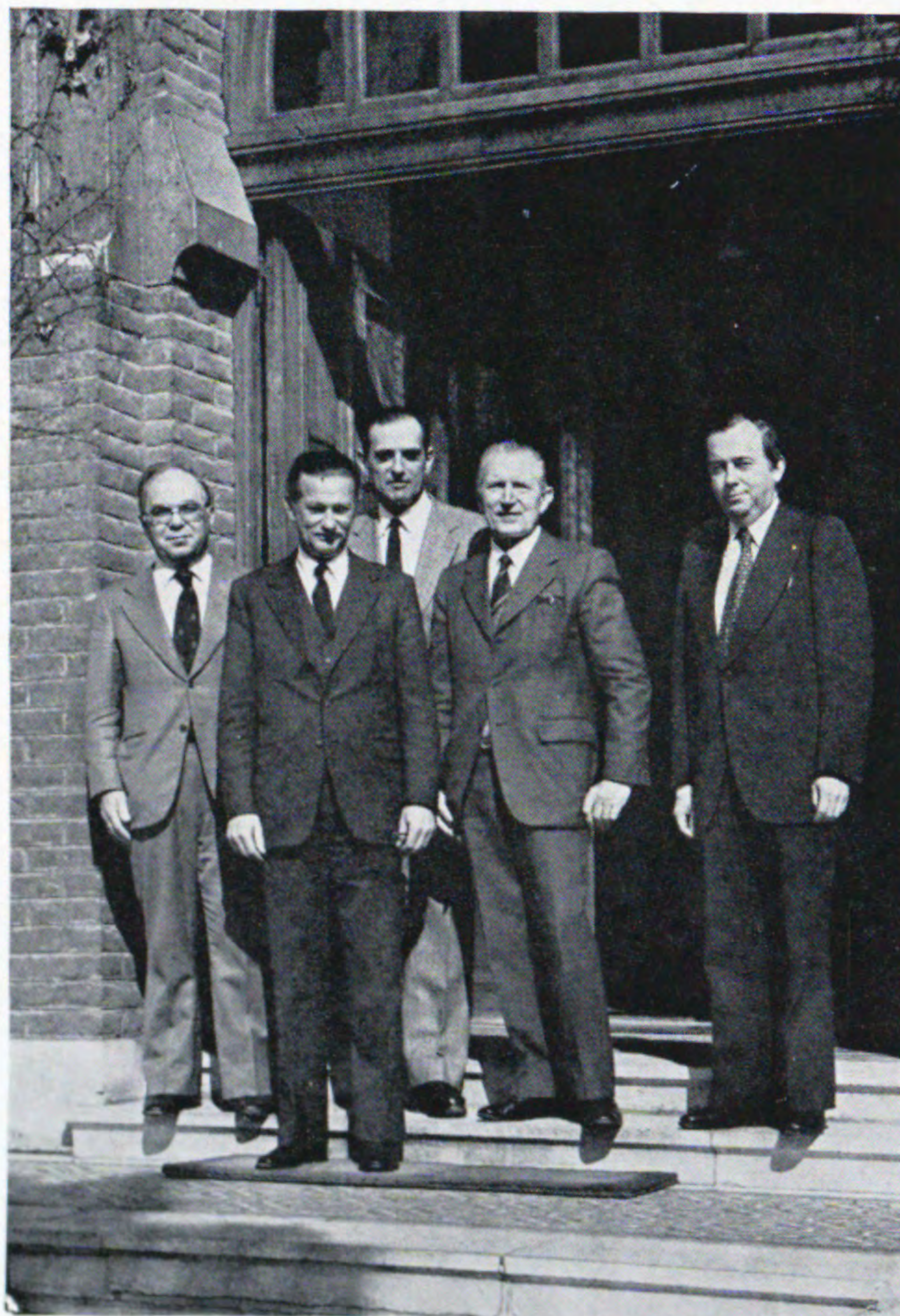
En el zaguán de las oficinas generales se tomó este testimonio gráfico de la visita de los señores Administradores.

El jueves día 26, tras el almuerzo, los visitantes emprendieron el regreso desde el aeropuerto asturiano de Ranón, en Avilés.