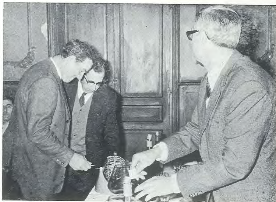
En el primer grabado, los dos bloques edificados por la Cooperativa en terrenos adquiridos de Solvay entre la carretera y la vía en las proximidades de la Casona. En el otro, uno de los cooperativistas en el momento de sacar la bola en el sorteo de las viviendas.

resantes ofertas, pues quedarán anexionados a la propiedad de cada vivienda