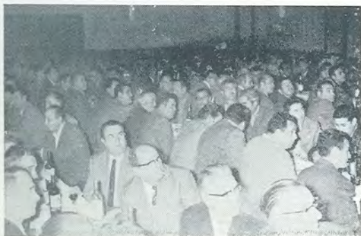
En la reunión con el personal, en el Cinema, en la que fue tomada esta vista parcial de la sala, actuaron con el agrado general y completo éxito, el Coro Santa María y el Grupo de Danzas (este último en el grabado) ambas secciones dentro de nuestras Obras Sociales.