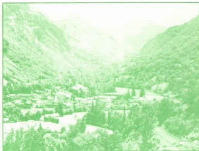
Valle con vegetación nativa

Todas las investigaciones coinciden en resaltar los impactos negativos de las introducciones masivas de estas especies foráneas agravándose particularmente cuando estos monocultivos sustituyen a las escasas y regresivas manchas de bosque autóctono.