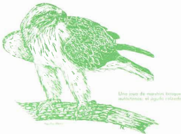
Una joya de nuestros bosques autóctonos: el águila real