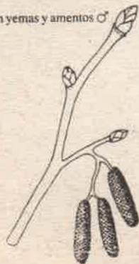
Rama con yemas y amentos ♂