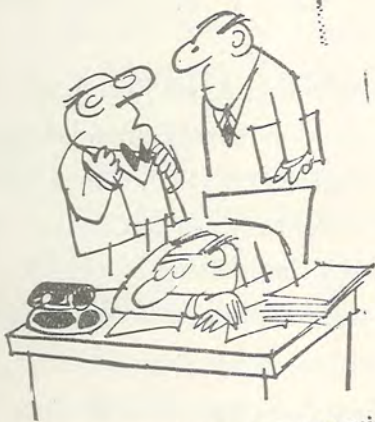
—No le despierte. Por lo menos mientras duerme no pide anticipos.