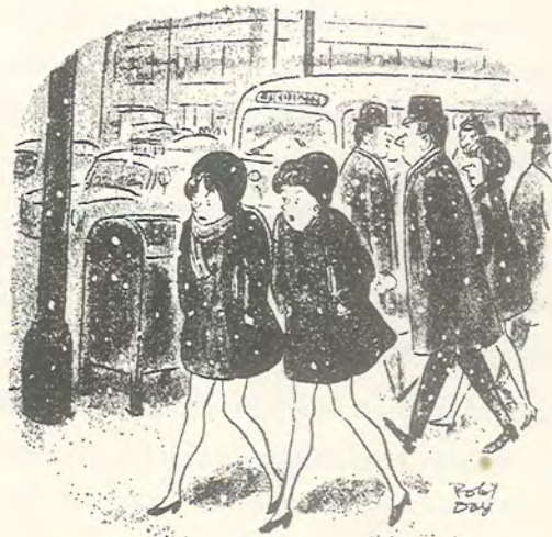
—¿Por qué será que cada invierno notamos más el frío?