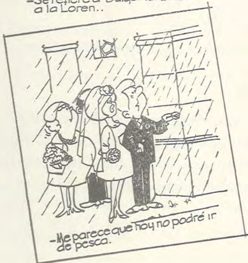
—Me parece que hoy no podré ir de pesca.