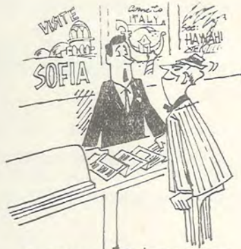
—Se refiere a Bulgaria u no a la Loren..